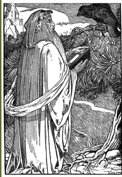
L'HERMITE DE LA MONTAGNE